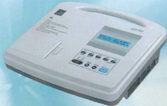
ECG-1101 Class B