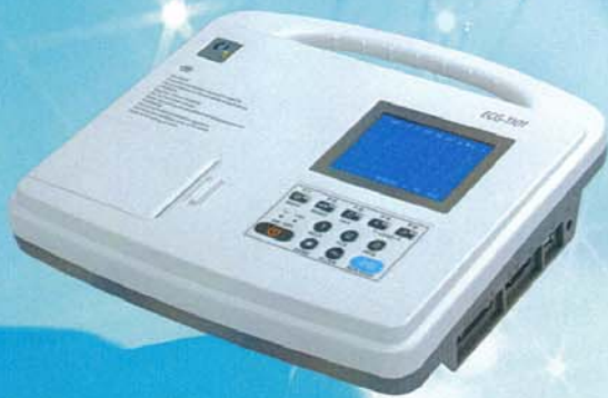
ECG-1101 Class G