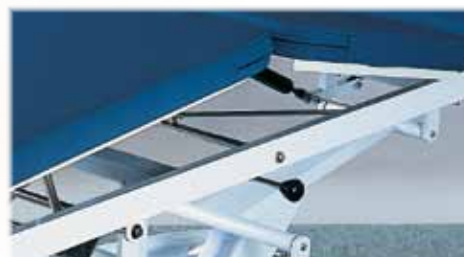
Palanca de posicionamiento de las secciones